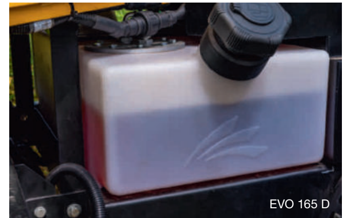
EVO 165 D