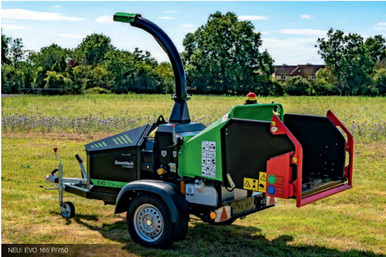
NEU: EVO 165 P/750

▶ MEHR BISS ▶ MEHR POWER ▶ MEHR DURCHSATZ